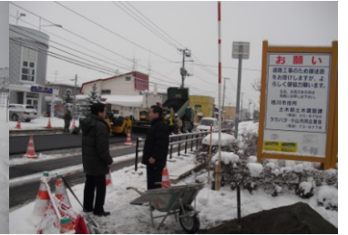
道路網整備現地調査 (12/18)