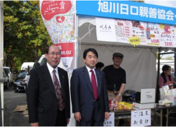
「食ベマツェ」日口協会も参加(10/9)