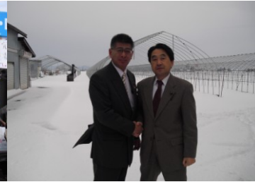
今年の農業対策現地調査(12/13)