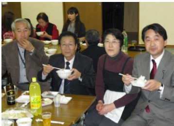
新米試食会・収穫感謝祭(11/13)