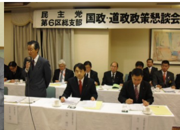
国政・道政政策懇談会(12/18)