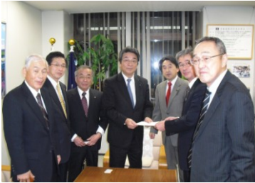
道教育長へ旭農充実強化要請(12/8)