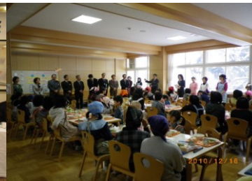
「米粉パン」学校給食見学 (12/16)